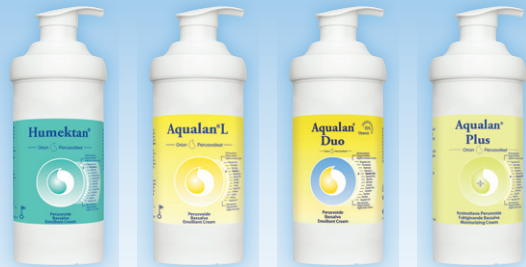
HUMEKTAN AQUALAN L AQUALAN DUO AQUALAN PLUS