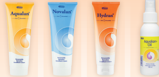
AQUALAN NOVALAN HYDRAN AQUALAN OIL