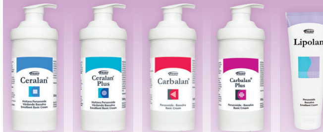
CERALAN CERALAN PLUS CARBALAN CARBALAN PLUS LIPOLAN